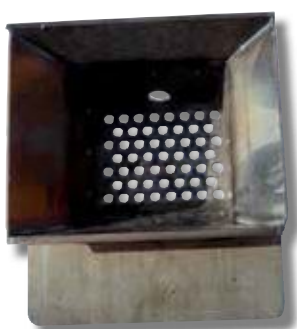
Exemple de creuset