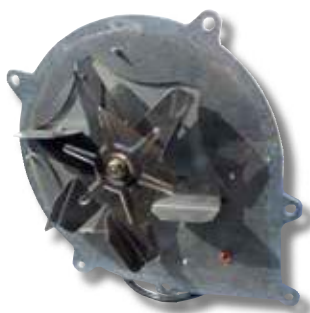
Extracteur de fumée démonté