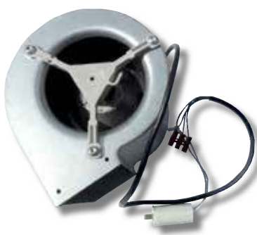
Exemple de ventilateur de convection centrifuge