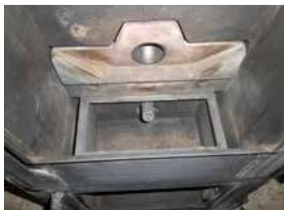
Vue intérieure sans le creuset : arrivée d'air, de granulé et bougie d'allumage

Il existe des contrats d'entretien vous permettant de programmer en toute confiance l'intervention de nettoyage par votre professionnel.