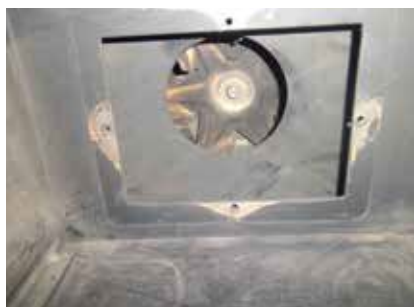
Vue intérieure : extracteur de fumée