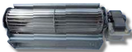
Exemple de ventilateur de convection tangentielle